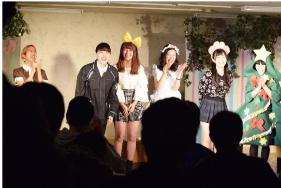
ピカ☆マイメンバー2