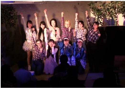
ピカ☆マイメンバー1