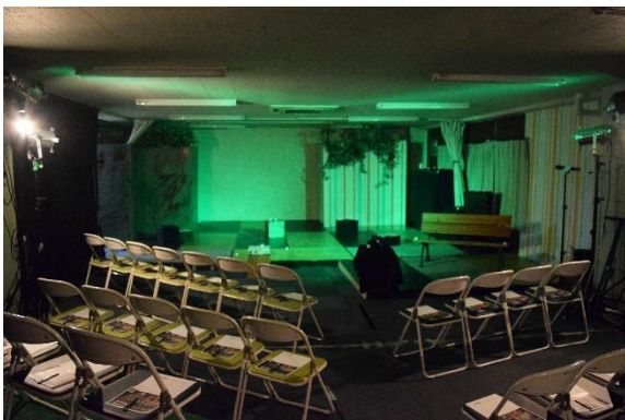
秋葉原ワンライブ劇場