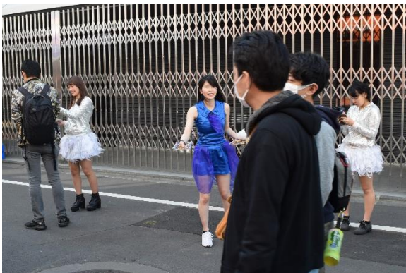
秋葉原で公演チラシを配布するメンバーたち